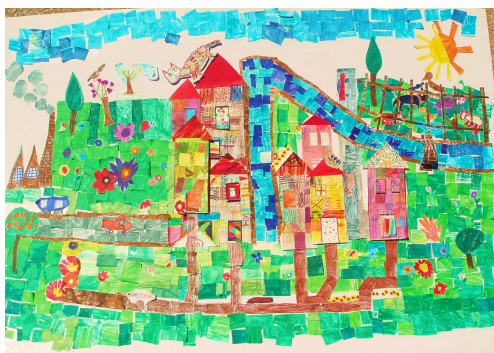
Εικόνα 2. Η τελική μορφή του πίνακα.